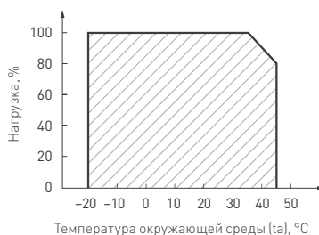
Рисунок 2. Максимальная допустимая нагрузка, % от мощности источника